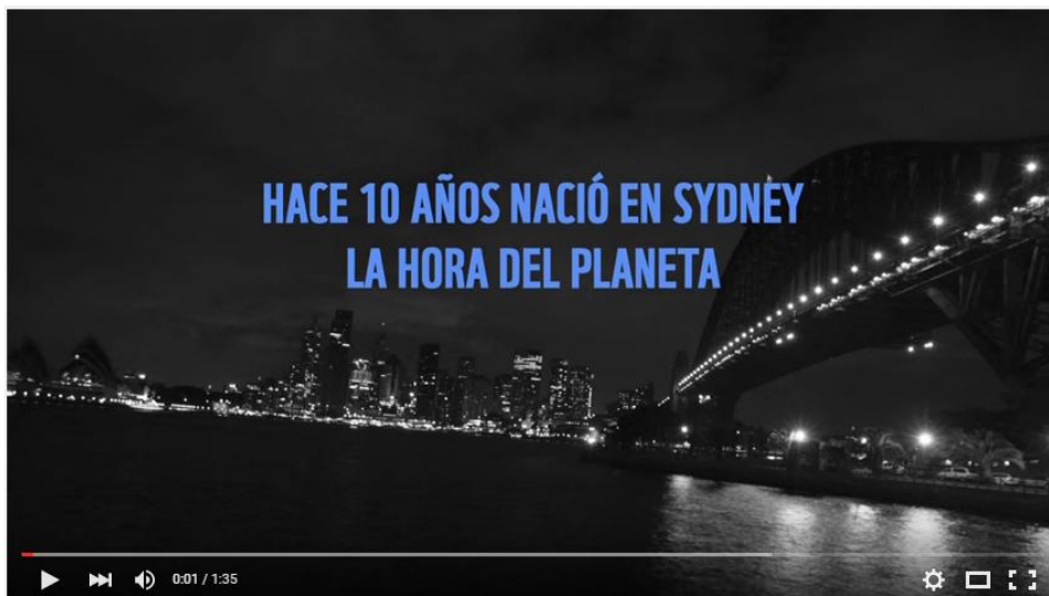
La Hora del Planeta 2016

La Hora del Planeta es una campaña de WWF que empezó en 2007 en Sidney, Australia, como un gesto simbólico de la lucha contra el cambio climático. Diez años después, se ha convertido en la mayor campaña de movilización ambiental de la historia. Una expresión multitudinaria del sentir de millones de personas que están pidiendo la implicación comprometida de todos frente al cambio climático, la mayor amenaza ambiental a la que nos enfrentamos.